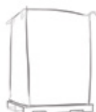
Saco a granel